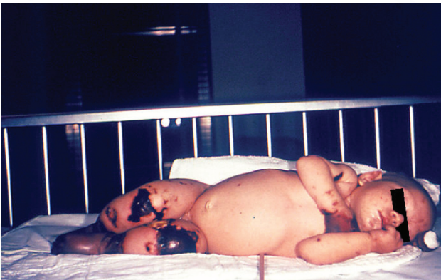
รูปที่ 22 เด็กทารกเพศหญิงอายุ 4 เดือน มีภาวะติดเชื้อ Meningococcal ในกระแสโลหิต (meningococcaemia) พบ ลักษณะเนื้อตายที่แขนขา (4 month old female with gangrene of hands and lower extremities due to meningococcaemia)