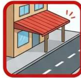
การต่อเติม