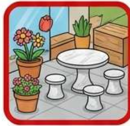
สิ่งของรुकล้า