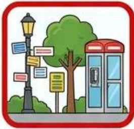
ป้ายกองโจร