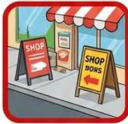
ป้ายตั้งพื้น