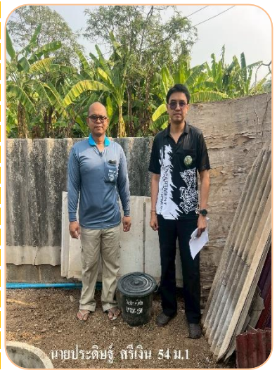
บ้านเลขที่ 54 หมู่ที่ 1