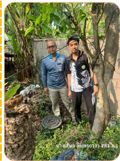
บ้านเลขที่ 49/1 หมู่ที่ 1