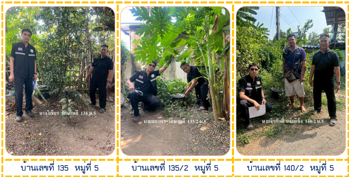
บ้านเลขที่ 135 หมู่ที่ 5