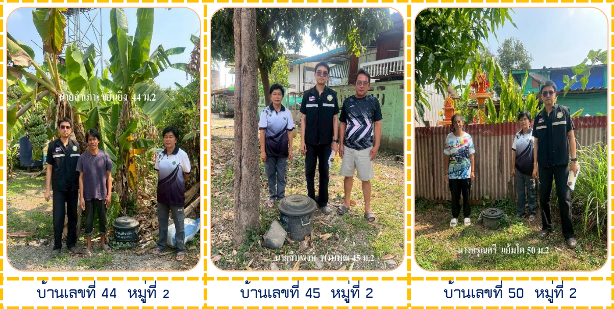
บ้านเลขที่ 44 หมู่ที่ 2