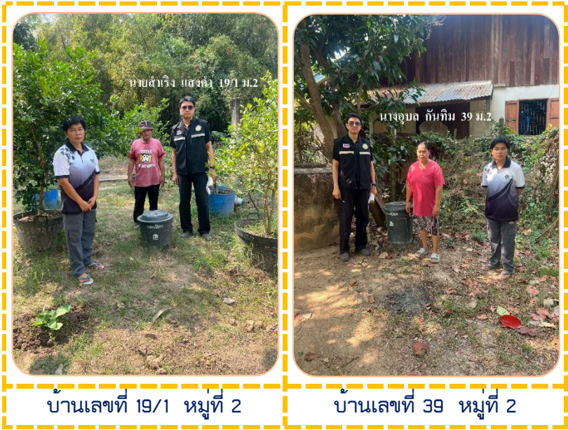
บ้านเลขที่ 19/1 หมู่ที่ 2