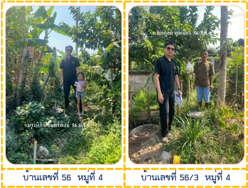
บ้านเลขที่ 56 หมู่ที่ 4