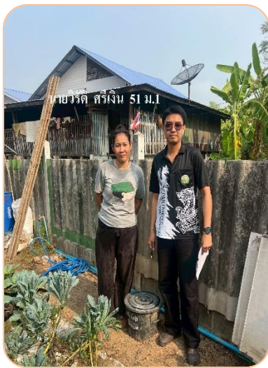
บ้านเลขที่ 51 หมู่ที่ 1