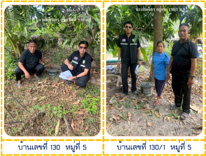
บ้านเลขที่ 130 หมู่ที่ 5