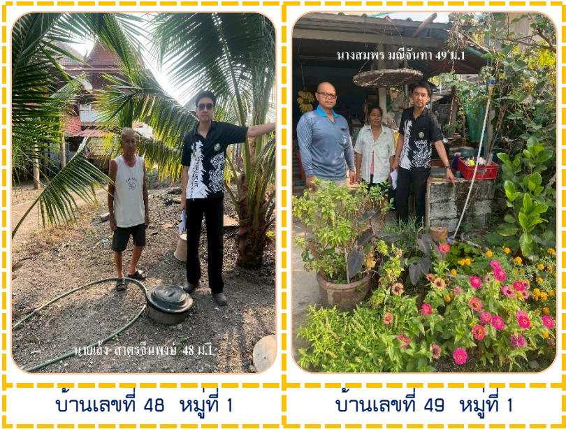
บ้านเลขที่ 48 หมู่ที่ 1